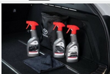
Zestaw kosmetyków samochodowych Toyota Kosmetyki